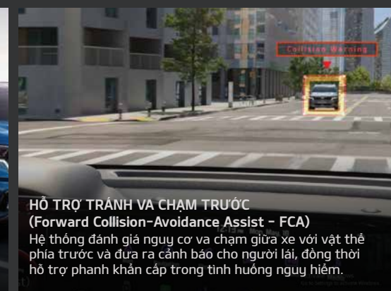
HỖ TRỢ TRÁNH VÀ CHẠM TRƯỚC (Forward Collision-Avoidance Assist - FCA) Hệ thống đánh giá nguy cơ va chạm giữa xe với vật thể phía trước và đưa ra cảnh báo cho người lái, đồng thời hỗ trợ phanh khẩn cấp trong tình huống nguy hiểm.