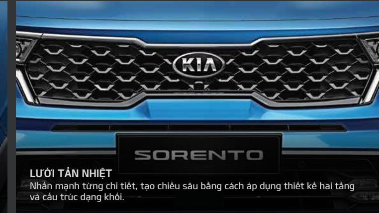
LƯỚI TẢN NHIỆT Nhấn mạnh từng chi tiết, tạo chiều sâu bằng cách áp dụng thiết kế hai tầng và cấu trúc dạng khối.