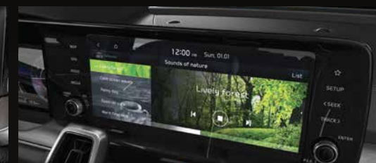
Màn hình AVN LCD 10.25" có độ phân giải cao như một rạp chiếu phim thu nhỏ và có giao diện thân thiện với người dùng.