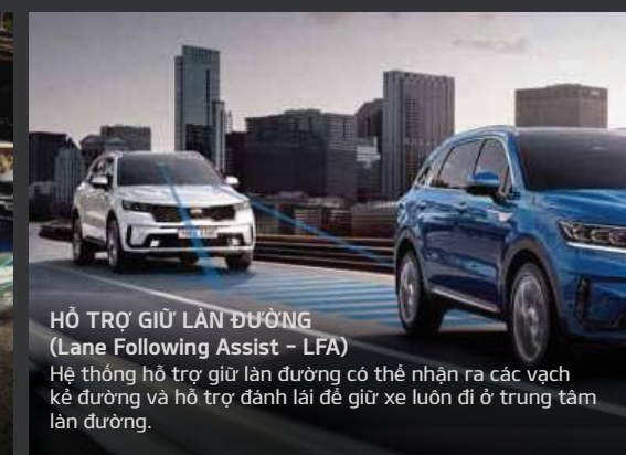
HỖ TRỢ GIỮ LÀN ĐƯỜNG (Lane Following Assist - LFA) Hệ thống hỗ trợ giữ làn đường có thể nhận ra các vạch kẻ đường và hỗ trợ đánh lái để giữ xe luôn đi ở trung tâm làn đường.