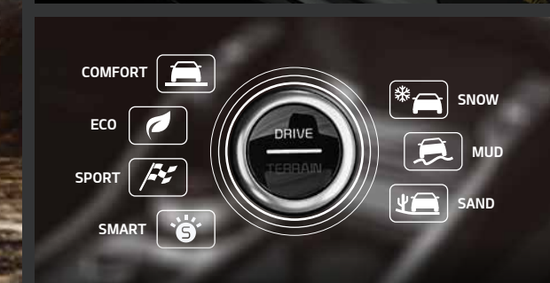
Trang bị 4 chế độ lái & 3 chế độ địa hình, KIA SORENTO (All New) mạnh mẽ và linh hoạt trên mọi cung đường.