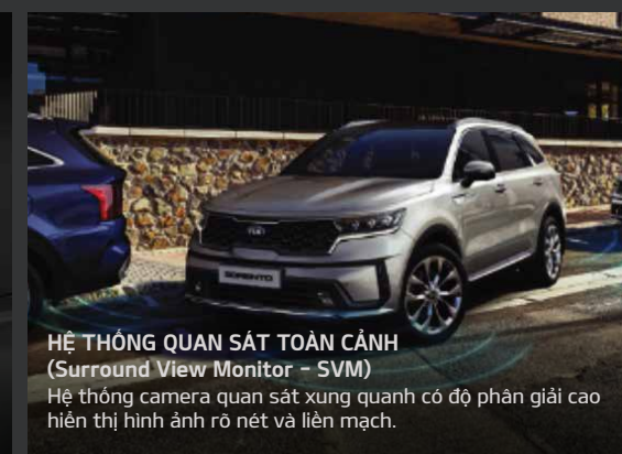
HỆ THỐNG QUAN SÁT TOÀN CẢNH (Surround View Monitor - SVM) Hệ thống camera quan sát xung quanh có độ phân giải cao hiển thị hình ảnh rõ nét và liền mạch.