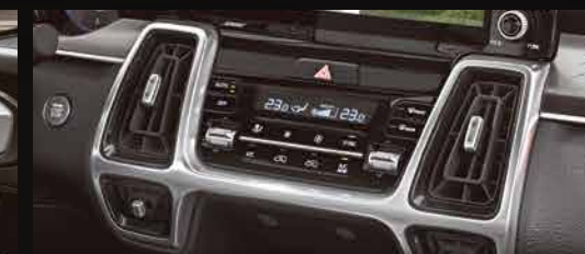
Cửa gió điều hòa với thiết kế phân tầng độc đáo gợi nhớ đèn ống dẫn động cơ máy bay phản lực tạo nên điểm nhấn cho khoang nội thất.