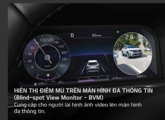
HIỂN THỊ ĐIỂM MÙ TRÊN MÀN HÌNH ĐA THÔNG TIN (Blind-spot View Monitor - BVM) Cung cấp cho người lái hình ảnh video lên màn hình đa thông tin.

KIA SORENTO (All New) được trang bị hệ thống an toàn chủ động thông minh vượt trội, mang lại sự an tâm và tin tưởng cho người dùng