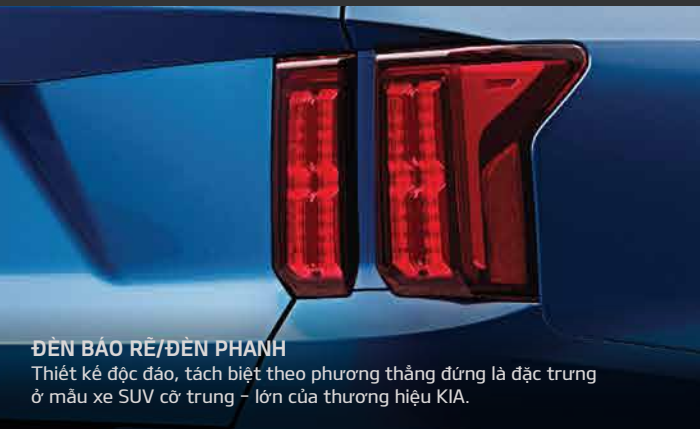
ĐÈN BẢO VỆ/ĐÈN PHANH Thiết kế độc đáo, tách biệt theo phương thẳng đứng là đặc trưng ở mẫu xe SUV cỡ trung - lớn của thương hiệu KIA.