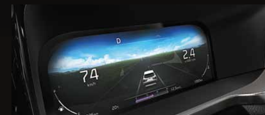
Cụm màn hình đa thông tin 12.3" cùng màn hình AVN 10.25" được thiết kế liền lạc mang đến không gian đậm chất công nghệ của tương lai.

Nội thất KIA SORENTO (All New) được thiết kế rộng rãi, tinh tế, sang trọng và hiện đại với nhiều trang bị tiện ích cao cấp