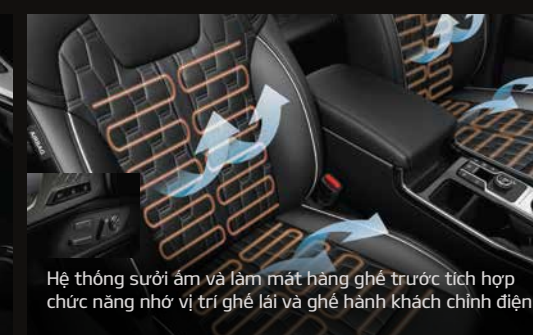
Hệ thống sưởi ấm và làm mát hàng ghế trước tích hợp chức năng nhớ vị trí ghế lái và ghế hành khách chính diện