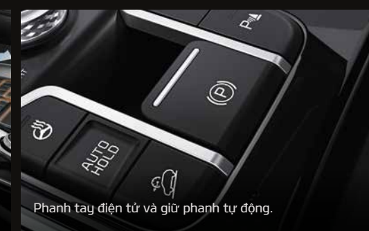
Phanh tay điện tử và giữ phanh tự động.