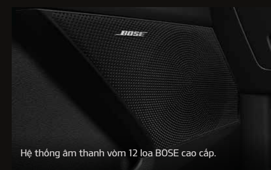
Hệ thống âm thanh vòm 12 loa BOSE cao cấp.