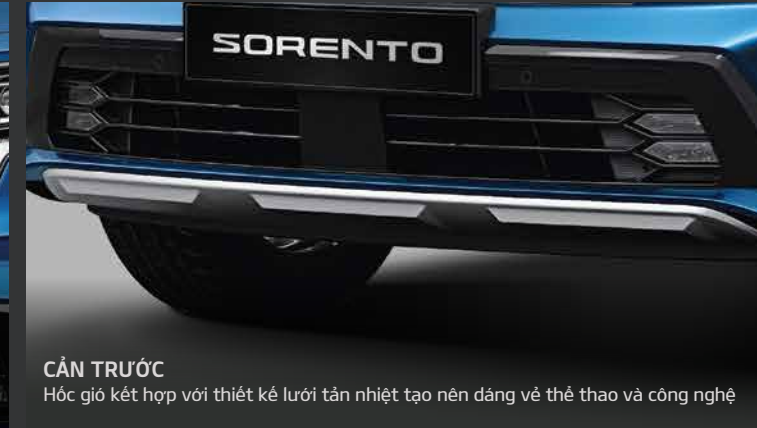
CẢN TRƯỚC Hộc gió kết hợp với thiết kế lưới tản nhiệt tạo nên dáng vẻ thể thao và công nghệ.