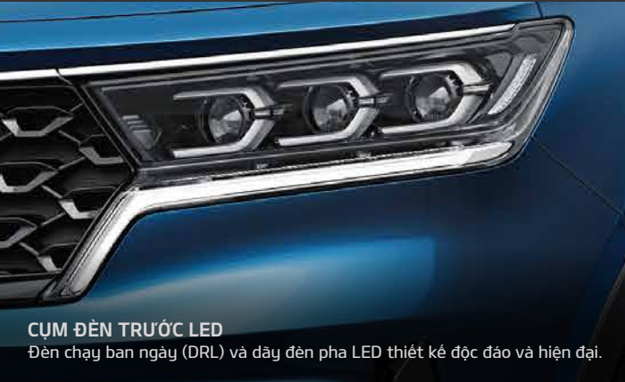
CỤM ĐÈN TRƯỚC LED Đèn chạy ban ngày (DRL) và đèn pha LED thiết kế độc đáo và hiện đại.