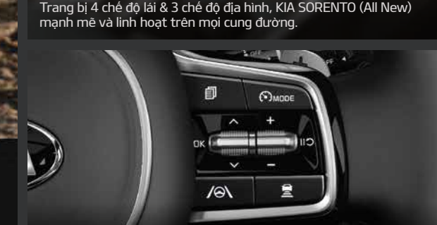
ĐIỀU KHIỂN HÀNH TRÌNH THÔNG MINH (Smart Cruise Control - SCC) Hệ thống tính toán vị trí tương đối so với phương tiện phía trước để đảm bảo cự ly an toàn giữa 2 xe khi lưu thông trên đường.