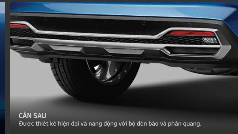
CẢN SAU Được thiết kế hiện đại và năng động với bộ đèn bảo vệ và phản quang.