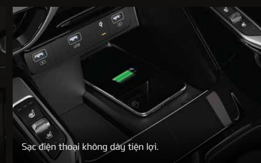
Sạc điện thoại không dây tiện lợi.