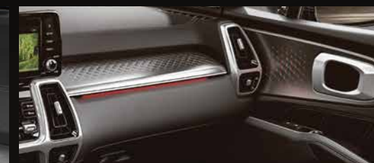
Đèn nội thất với hiệu ứng ánh sáng thay đổi theo chế độ lái hoặc thời gian trong ngày cũng khả năng tùy chỉnh mang lại sự hiện đại và sang trọng.