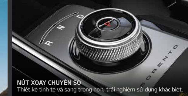
NÚT XOAY CHUYỂN SỐ Thiết kế tinh tế và sang trọng hơn, trải nghiệm sử dụng khác biệt.