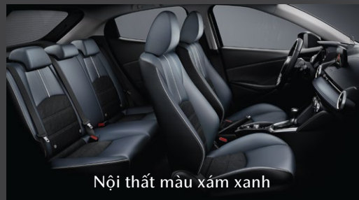
Nội thất màu xám xanh

Chủ đề thiết kế không gian bên trong của Mazda2 là nghệ thuật thể hiện sự hài hòa của ánh sáng và bóng tối, cùng với chất lượng vật liệu để có thể tạo ra màu sắc phong phú và vẻ đẹp cho không gian.