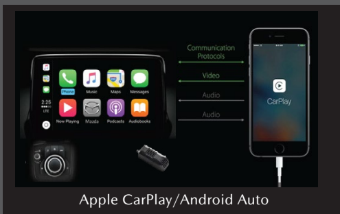
Apple CarPlay/Android Auto

Tận hưởng việc lái xe như một niềm vui với các trang bị cao cấp, tiện lợi được lựa chọn cẩn thận và dễ dàng sử dụng.