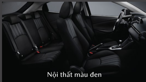
Nội thất màu đen