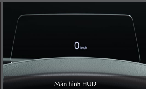
Màn hình HUD