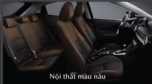
Nội thất màu nâu