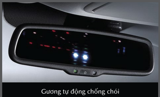
Gương tự động chống chói